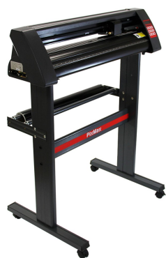
(a) Vinylskärare, 300 pund

Sådana finns det en hel djungel av! Jag har hittat några förslag och rekommenderar att beställa en PixMax från MonsterShop (UK). Motiveringen lyder: Med en skärbredd på 72 cm, hastighet på 800 mm/s och stabilt stöd med hjul är PixMax förhoppningsvis en arbetsduglig och långlevd vinylskärare som kommer följa sektionens och Dragos minsta vink! Till denna skulle en värmpress, modell svingarm med 38x38cm platta, och möjligtvis en värmpress specifikt för muggar göra så att alla har möjligheten att visa upp sektionen och sig själva för omvärlden!