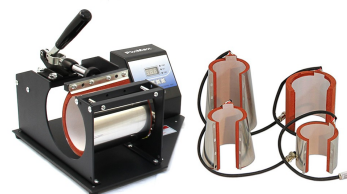
(c) Värmpress för muggar, 200 pund