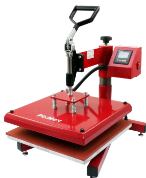
(b) Värmpress, 243 pund